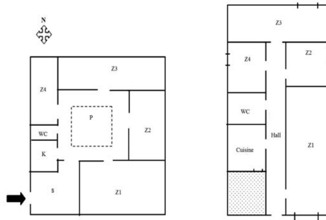
Fig.1: Plan synoptique d'une maison à patio et d'une maison type moderne

Le vitrage est simple d'une épaisseur de 4 mm, d'une conductance hors résistances superficielles égale à 5 \text{ W/m}^2\text{K} et de facteur solaire égal à 0.85 avec un cadre en bois.