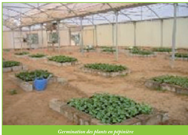
Germination des plants en pépinière

- Les utilisations potentielles de l'huile produite et des déchets.