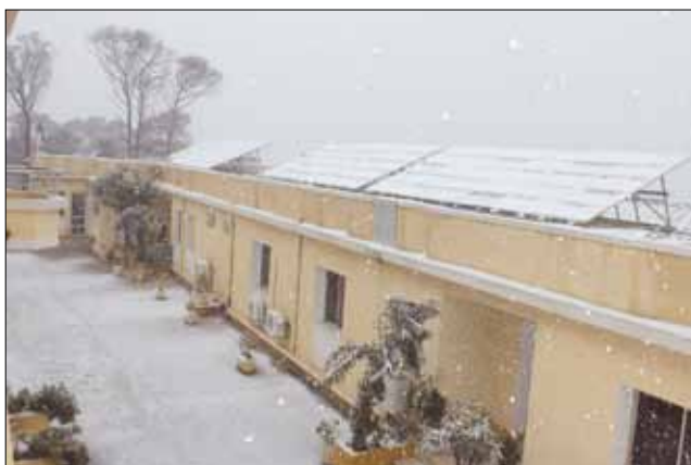
Générateur photovoltaïque sous la neige au CDER, Bouzareah, Alger.